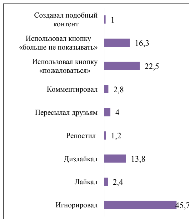
Рис. 2. Действия респондентов 15-25 лет по отношению к контенту с пропагандой экстремизма и терроризма (2019 г.), %

Кроме того, в интернете можно также столкнуться с призывами к несанкционированным действиям (нарушению порядка проведения собрания, митинга, демонстрации и т.д.): с таким контентом столкнулось 72% респондентов, из них 71% девушек и 74% юношей. Из тех, кто сталкивался с подобным контентом, больше половины просто игнорировало его, а каждый десятый дизлайкал и отправлял жалобу администрации ресурса.